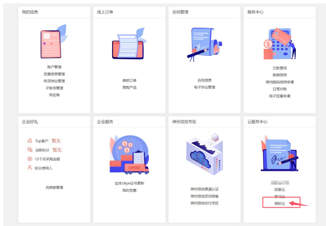
【代理商个人中心页面】